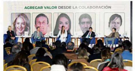
“AGREGAR VALOR DESDE LA COLABORACIÓN” FUE EL ÚLTIMO PANEL.

“Lo que estamos viviendo en nuestra Araucanía nos lleva a que podamos tener una visión de futuro en conjunto ante los problemas que estamos viviendo desde hace muchos años