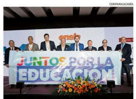
UNO A UNO SUS INTEGRANTES FIRMARON EL ACTA DE COMPROMISO.

clases, lograr una amplia cobertura en educación inicial (un 20% no puede hacerlo porque no hay matrículas disponibles), abordar el rezago lector para que los niños aprendan a leer bien y a tiempo mejorando así sus oportunidades futuras y que la Región esté por sobre el promedio nacional del Simce en las pruebas de Lectura y Matemáticas en cuarto básico. ☞